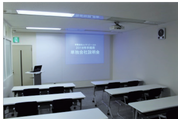
▼プロジェクター利用可