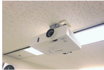
▼天吊りプロジェクター